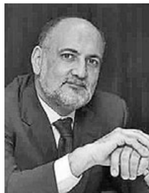
PRESIDENTE del Constitucional, Pérez de los Cobos.

ciantes al magistrado Francisco Pérez de los Cobos, presidente del Tribunal Constitucional, al magistrado Eloy Velasco, titular del Juzgado Central de Instrucción número Seis de la Audiencia Nacional, y al magistrado Ángel Antonio Blasco Pellicer,